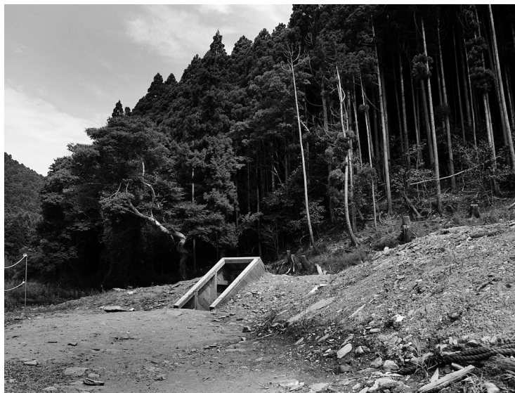
CHIM↑POM, HITOKAKERA, 2017, ENTRÉE DE L'INSTALLATION À ISHINOMAKI, PHOTO : MAEDA YUKI © CHIM↑POM, COURTESY OF THE ARTIST, ANOMALY, AND MUJIN-TO PRODUCTION

CHIM↑POM : Oui. Il faut qu'on puisse transmettre notre message et notre art aux gens qui ne sont pas intéressés par l'art.