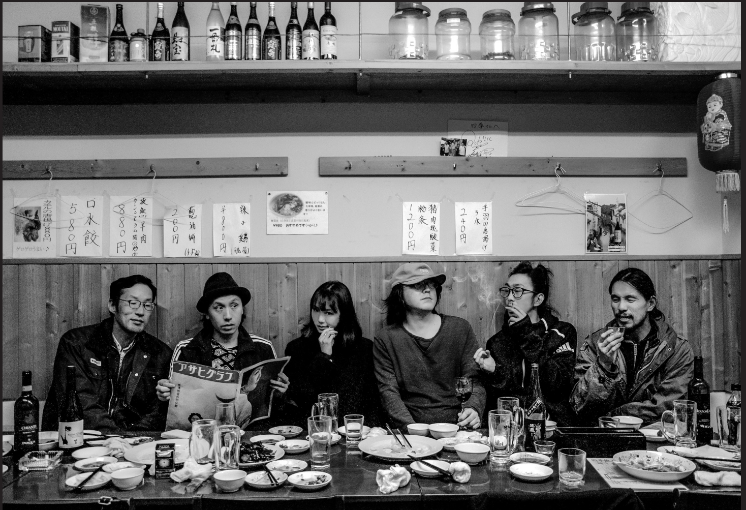
LES SIX MEMBRES DE CHIM↑POM, 2019