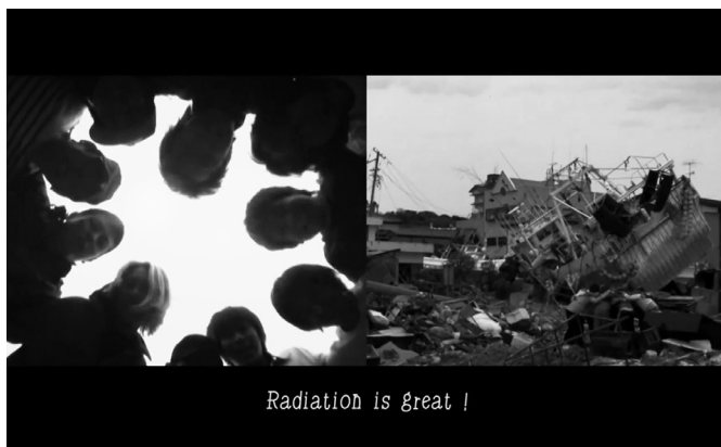
CHIM↑POM, KI-AI 100 (100 CHEERS) , 2011, VIDÉO © CHIM↑POM, COURTESY OF THE ARTIST, ANOMALY, AND MUJIN-TO PRODUCTION