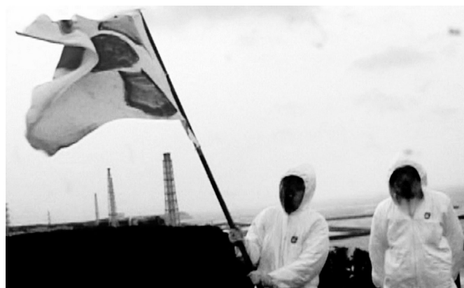
CHIM↑POM, REAL TIMES , 2011, VIDÉO © CHIM↑POM, COURTESY OF THE ARTIST, ANOMALY, AND MUJIN-TO PRODUCTION EN ARRIÈRE-FOND, LA CENTRALE NUCLÉAIRE DE FUKUSHIMA DAIICHI

CHIM↑POM : À ce moment-là, j'ai vraiment pensé qu'il y avait cette nécessité d'une démarche physique. D'abord parce qu'il n'y avait pas d'information : l'information, on devait aller la chercher. Il y avait des endroits où on voyait que les journalistes ne pouvaient pas aller : ceux qui devaient reconstruire, par contre, étaient obligés d'y aller. C'était donc un acte complètement spontané : je devais vraiment y aller pour faire quelque chose.