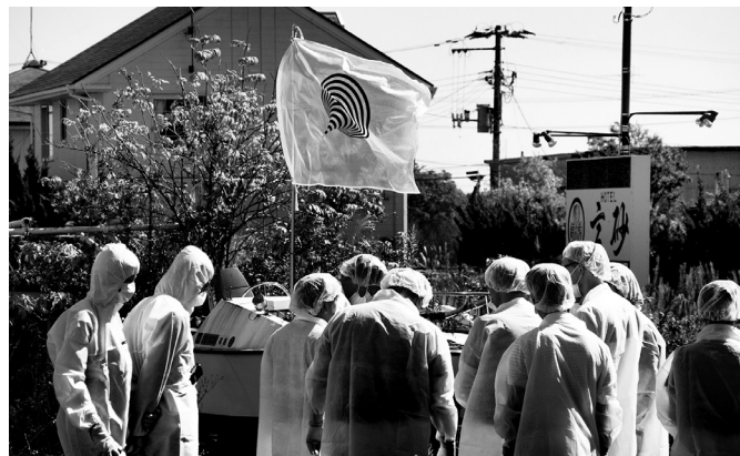
CHIM↑POM, LEVEL 7, FEAT. "MYTH OF TOMORROW", 2011 © CHIM↑POM, COURTESY OF THE ARTIST, ANOMALY, AND MUJIN-TO PRODUCTION